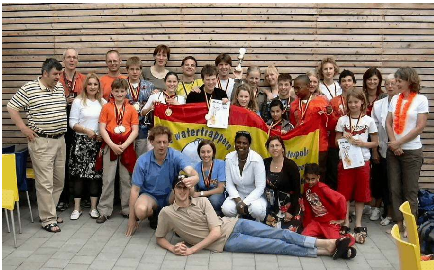
Groepsfoto met alle zwemmers, begeleiders en supporters.