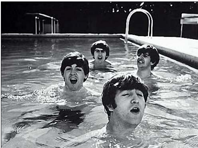
Ook zij konden zwemmen