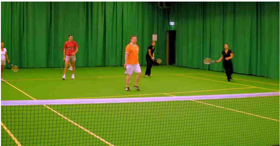
Nog even warm draaien vlak voor de eerste wedstrijden.

www.haloo.demon.nl/2008tennis omdat de plek waar het DWT foto album staat momenteel verheringericht/verplaatst wordt.