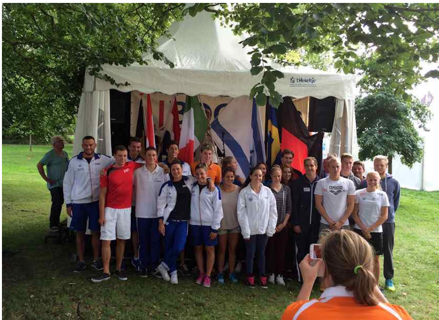
Foto verslag Openwater te Hoorn