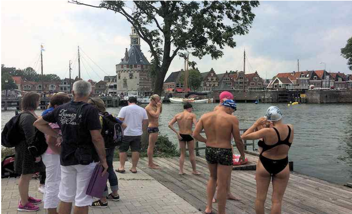
Wedstrijdzwemmen: Openwater te Hoorn

De Waterdruppels is het officiële tijdschrift van de Haarlemse zwemvereniging 'De Watertrappers' (DWT) en verschijnt tien keer per jaar.