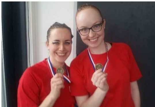
Brons voor het master duet.

De NK en NK Masters bestaat uit twee onderdelen. De eerste dag worden de technische kuren gezwommen. De technische kuren bevatten vaste figuren en onderdelen die erin moeten worden opgenomen. Het master duet