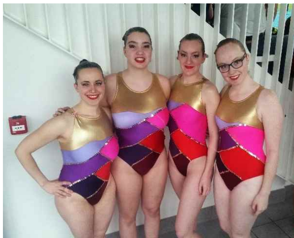
Vrije kur ploeg.