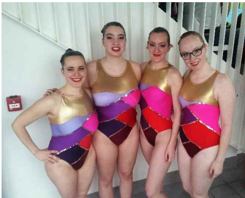
NK & NK Masters Synchronzwemmen (pagina: 5)