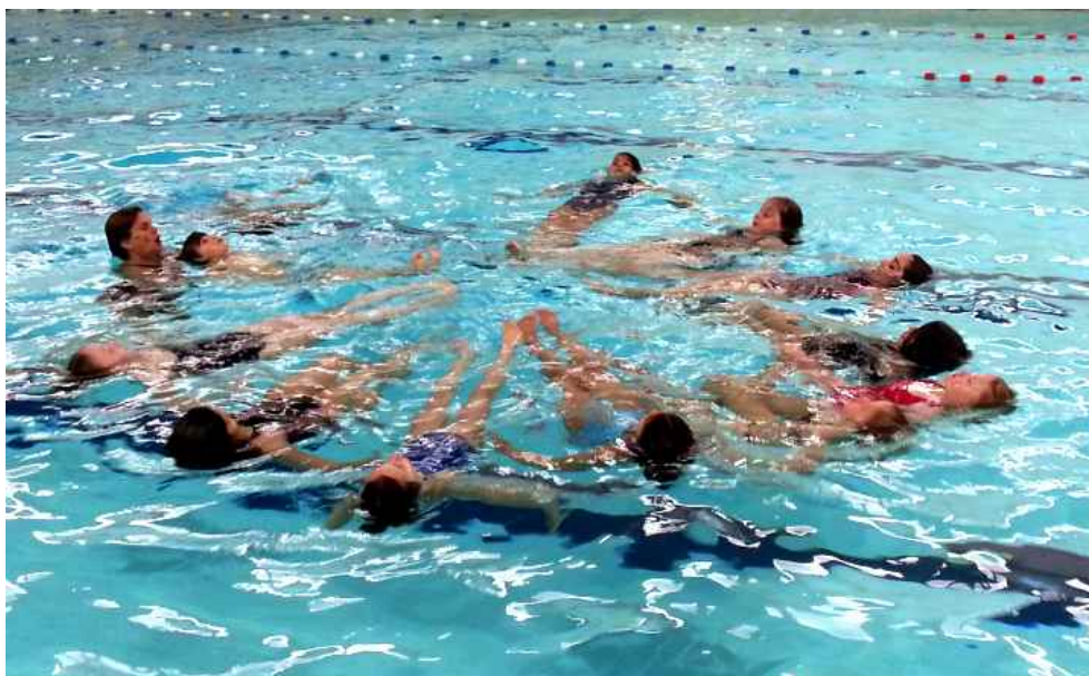
Junior Pro - zie pagina 13

De Waterdrippels is het officiële tijdschrift van de Haarlemse zwemvereniging 'De Watertrappers' (DWT) en verschijnt tien keer per jaar.