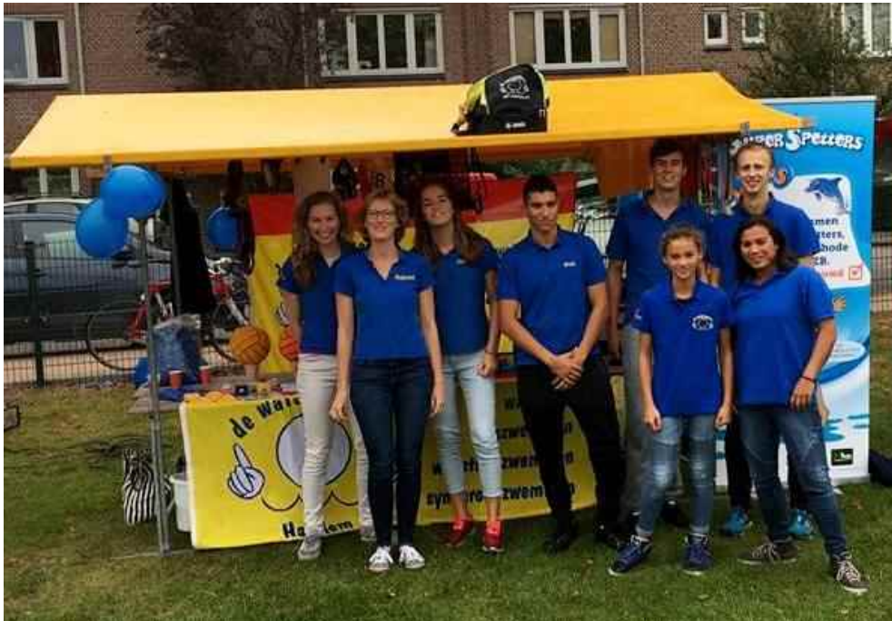
DWT op de Sportfair

De Waterdrippels is het officiële tijdschrift van de Haarlemse zwemvereniging 'De Watertrappers' (DWT) en verschijnt tien keer per jaar. Jaargang 76, nr.8, oktober 2016