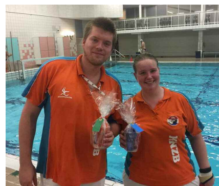
Gastscheidsrechters hebben afgelopen zaterdag net hun presentje gekregen.

inzet. Vorige week zaterdag 1 oktober en aankomende zaterdag 8 oktober zullen alle scheidsrechters die bij ons komen fluiten in het zonnetje worden gezet. Onze eigen verenigingsscheidsrechters komen vrijdag 7 oktober 20.00 uur gezellig en drankje en wat lekkers nuttigen in het clubhuis. Dus vind je het gezellig om een praatje te maken/vragen te stellen met onze scheidsrechters, kom gezellig langs.