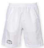
LEGACY SHORT maten: 116-128-140-152-164-S-M-L-XL-XL