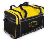
MILTON ELITE BAG