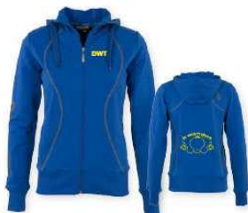
HOODED SWEAT FULL ZIP LADIES maten: XS-S-M-L-XL-XL