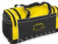
LEYTON ELITE BAG