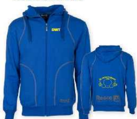
HOODED SWEAT FULL ZIP UNISEX maten: 128-140-152-164-S-M-L-XL-XL