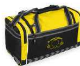
SHELTON ELITE BAG