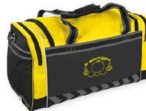
LEYTON ELITE BAG