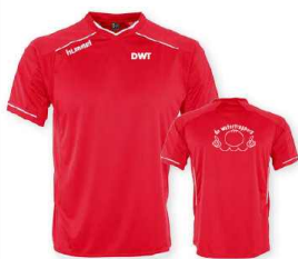
LEEDS SHIRT KM maten: 116-128-140-152-164-S-M-L-XL-XXL