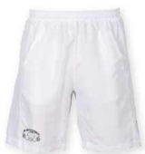
LEGACY SHORT maten: 116-128-140-152-164-S-M-L-XL-XXL