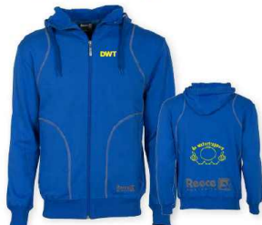
HOODED SWEAT FULL ZIP UNISEX maten: 128-140-152-164-S-M-L-XL-XXL