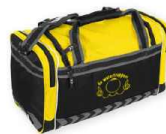
SHELTON ELITE BAG