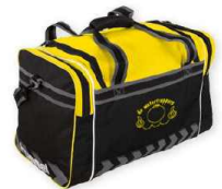
MILTON ELITE BAG