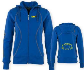
HOODED SWEAT FULL ZIP LADIES maten: XS-S-M-L-XL-XXL