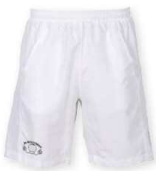
LEGACY SHORT maten: 118-128-140-152-164-S-M-L-XL-XXL