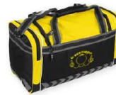
SHELTON ELITE BAG