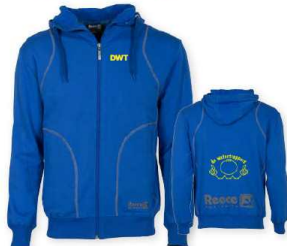
HOODED SWEAT FULL ZIP UNISEX maten: 128-140-152-164-S-M-L-XL-XXL