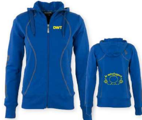
HOODED SWEAT FULL ZIP LADIES maten: XS-S-M-L-XL-XXL