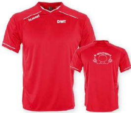
LEEDS SHIRT KM maten: 116-128-140-152-164-S-M-L-XL-XXL