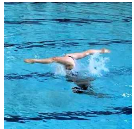
IR Jun Lift

Nadat de wedstrijd afgelopen was en de prijsuitreiking geweest was gingen wij met zijn allen naar de McDonalds om de goede dag gezellig af te sluiten. Maar het hoogtepunt van de dag was toch wel dat we een Pokémon (de mantarog) van de McDonalds hebben meegenomen voor de vriend van onze trainster ??