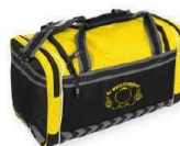
SHELTON ELITE BAG