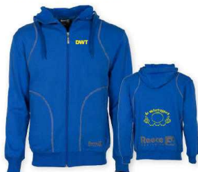
HOODED SWEAT FULL ZIP UNISEX maten: 128-140-152-164-S-M-L-XL-XXL