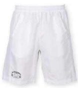
LEGACY SHORT maten: 116-128-140-152-164-S-M-L-XL-XXL

Na aanmelding ontvang je een bevestiging en uitleg (controleer je spambox ).