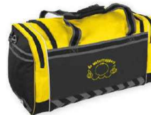
LEYTON ELITE BAG