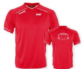
LEEDS SHIRT KM maten: 116-128-140-152-164-S-M-L-XL-XXL