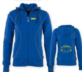
HOODED SWEAT FULL ZIP LADIES maten: XS-S-M-L-XL-XXL