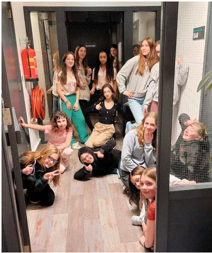
Op zondagmorgen werd iedereen om 8.30u weer aan het ontbijt

verwacht om daarna de kamers weer op te ruimen. Vervolgens gingen wij op pad naar een gymzaal voor land- en droogtraining. Tussendoor werd de uitslag van de eerder genoemde quiz ook nog gedeeld en die eer ging naar de zwemsters van de Age II. Vervolgens gingen wij pannenkoeken eten, zwemmen en nog meer zwemmen voor de combo-groep. Uiteindelijk was het kamp om 15u afgelopen voor iedereen tot en met Age I en heeft de combo met de laatste energie nog even door geknald tot 16u.