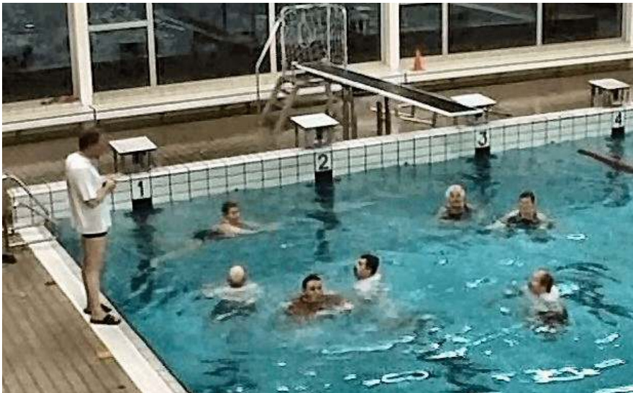
Het begin van de zwemproef

Zo was er een groep mensen druk bezig om te oefenen voor het A-diploma. Iedere week waren deze heren van de partij. Geen vrijdag werd overgeslagen. In mei verschenen deze heren ineens in pantalon, T-shirt en gymshoenen in de zwemzaal. Iedere week gingen de heren met een tas natte kleding weer huiswaarts.