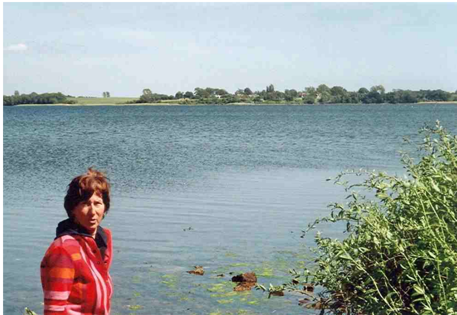
Juni 2009: gezicht op Svenmarke vanaf de oever aan de baai bij Stege.