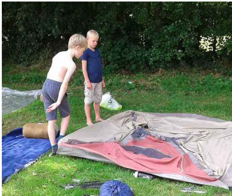
DWT jeugkamp. (zie pagina 10)

De Waterdrippels is het officiële tijdschrift van de Haarlemse zwemvereniging 'De Watertrappers' (DWT) en verschijnt tien keer per jaar. Jaargang 76, nr.7, september 2016